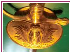
Epée d'officier de la compagnie des Cent-suissees – Restauration Service de France