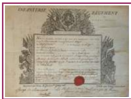
Photo de droite : Détails de la signature du lieutenant de Karrer, chef du détachement des Gardes suisses de Normandie