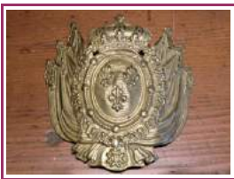
Plaque de shako du 2 ème régiment suisse Service de Naples