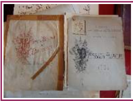
Planche des uniformes des régiments suisses sur la Parade-Platz à Maastricht en 1815, d'après une aquarelle de Tavel, original de Pochon