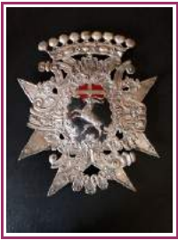
Plaque de shako – Restauration Service de France